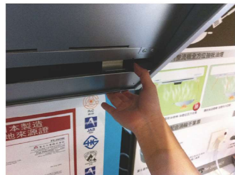
兩手分別抓住集油蓋的兩邊，把集油蓋的頂部朝下拉出來