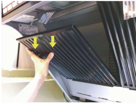
把過濾網取下時抓牢，以免滑落引起受傷