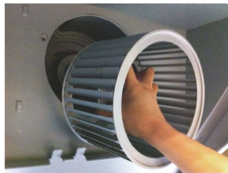
把渦輪式千葉風扇取出