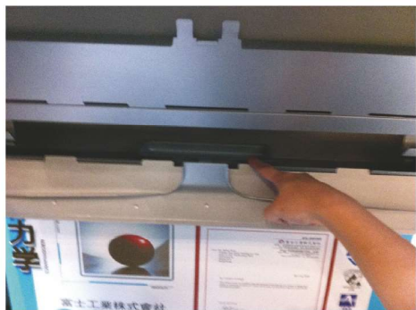
儲油盤便可從機體取出