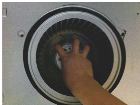
把六角風扇螺絲拆除