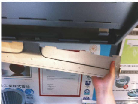
然後把集油蓋從機體中脫離出來，便可把集油蓋板清洗