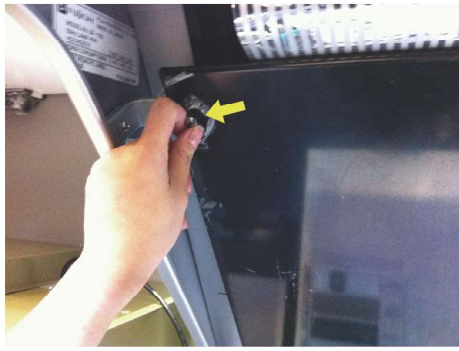
鬆開安裝在整流板上的裝配螺絲