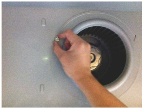
鬆開風扇外環的螺絲