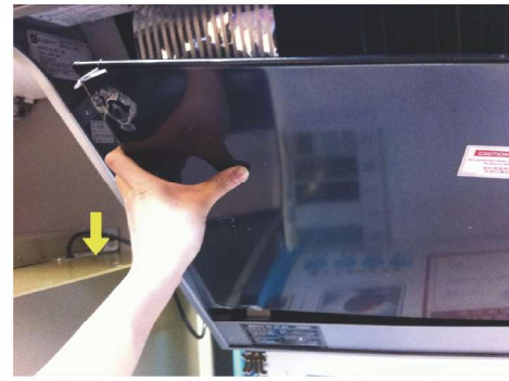
讓裝配螺絲從裝配槽孔和機體扣拴上取下，把整流板稍稍向上移動並取出