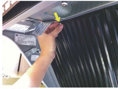
按逆時針方向轉動鬆開各個固定過濾網的旋鈕